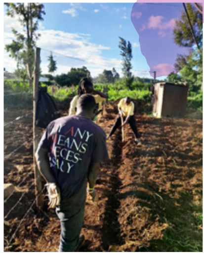
シェルターの裏に借りた土地で農作業

M …具体的な計画は？ 植 …このクラウドファンディングでいただいたお金がどのよう