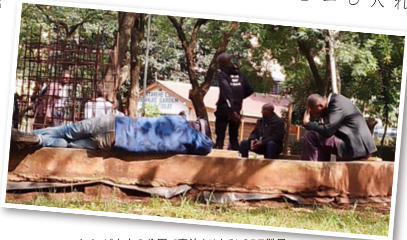
ナイロビ市内の公園で寝泊まりするLGBT難民

ことを期待しています。それから、ケニアやウガンダの人達が作る物を日本に紹介もしたい。LGBTのコミュニティだけでなく地域の人たちの利益に繋がることかしたいなと思っています。 M …クラウドファンディングへの反響は？ 植 …目標額以上を達成しました。今回クラウドファンディングのための説明会を日本国内でも行いました。今後は大都市だけではなく、たとえば愛媛や天草などでもやりたい。 M …天草！ キリスト教迫害の歴史で有名な土地ですね。 植 …そうですね。興味深いのは愛媛には技能実習生が多くいるし、天草のキリスト教迫害の歴史も現代と繋がっているなと思えることがあって。 M …どんな点ですか？ 植 …例えば天草では、お寺や神社がキリスト教徒を匿っていたのですね。なぜかというキリスト教信者の人口は当時の天草では多数派です。だから彼らが迫害されたりなくなったりすることは天草の暮らしを揺るがす一大事だった。信仰を越えて人は繋がっていて、暮らしが双方で成り立っていく。迫害を野放しにしたら地域が崩れてしまう。共生がキーになるという点で現代の日本の課題ともリンクしていると思います。