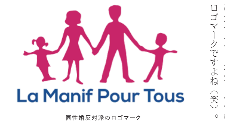
同性婚反対派のロゴマーク

課程を出てしばらくは動物擁護の活動をしているNPOで働いたのですが、仕事をやめて来日、今に至ります。十八歳ぐらいから自分はバイだと気づいていましたが、ひとりで悩んだ時期もあって、そんなときトランス女性のいとこ(当時はまだゲイな男性として自己認識していた)に随分助けられました。その後まず姉と兄に、数年後に両親にカミングアウトしました。それまでは両親から「従兄みたいにならないでね」と何度も言われ、そのたびに辛い思いをしたのを覚えています。