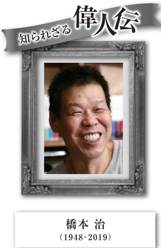
橋本 治 (1948-2019)

たぶん日本で初めて、「自分はゲイだ」ってはっきり言った作家。今回は一九七九年に出版された『花咲く乙女たちのキンピラゴボウ』というフザケたタイトルの少女漫画論をご紹介します！